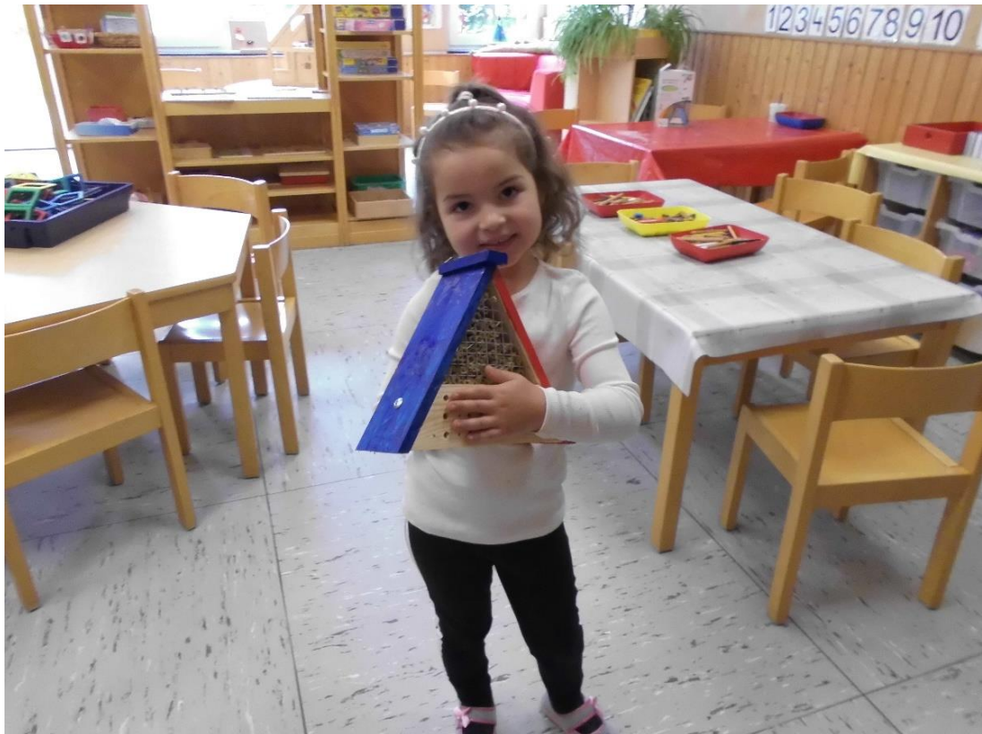
Mit sichtlicher Freude wird das fertige Insektenhotel präsentiert.