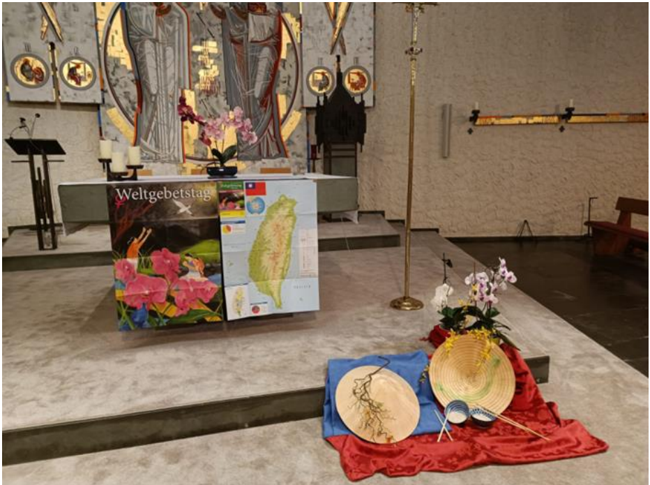
Foto: WGT-Gottesdienst in Niederklein

Betrachtung des diesjährigen Titelbildes. Anschließend kamen zahlreiche Frauen zu Kaffee und Kuchen im Pfarrheim zusammen. Auch hier gab es eine Kostprobe taiwanischer Backwaren.