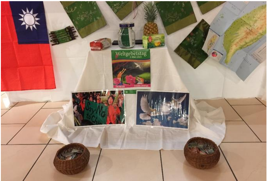
Foto: WGT-Gottesdienst in Christkönig

Nach dem Gottesdienst kamen die Besucherinnen zu einem kleinen Imbiss im Pfarrzentrum zusammen. Als taiwanische Spezialität wurden zum Abschluss leckere Ananas-Kokos-Bällchen serviert, die allen sehr gut geschmeckt haben.