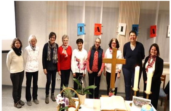
Fotos: WGT-Gottesdienst in Burgholz